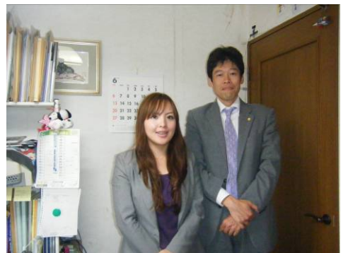
写真:尾上先生と邑上