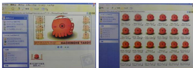
※実際にイカタクウイルスに感染したパソコンの画面の例です。