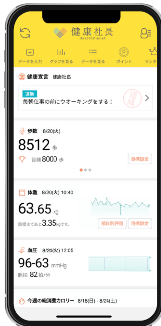
「タニタ健康プログラムwith健康社長」専用アプリトップ画面 (計測データの表示画面)