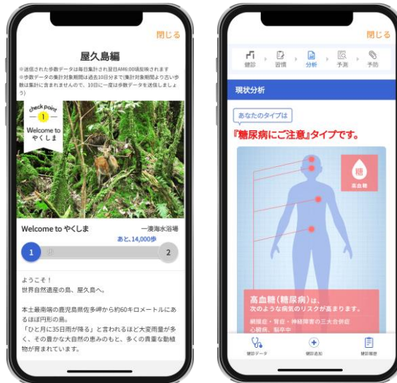
左より「ウォーキングラリー」「ミライフ」の画面